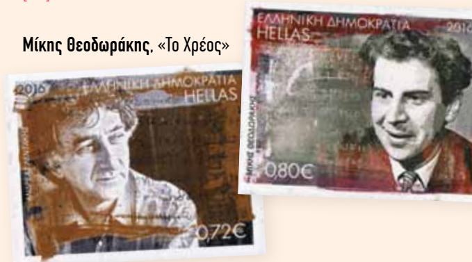
Μίκης Θεοδωράκης, «Το Χρέος»

Με μεταφέρουν στα χέρια. Αυτοκίνητο. «Άγιος Παύλος...» [...]